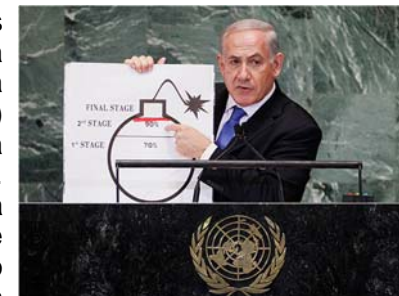
Premiê de Israel mostra cartaz com avanços militares do Irã em 2012

No dia seguinte às eleições israelenses que devem dar novo mandato a Benjamin Netanyahu, a Casa Branca expressou nesta quarta-feira (18) preocupação quanto ao uso de retórica de divisão pelo premiê israelense. Durante o pleito, Netanyahu havia alertado a população quanto ao fato de que árabes-israelenses cidadãos do país compareceram em grandes números às urnas.