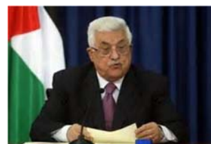
Presidente da ANP Mahmoud Abbas

Mahmoud Abbas, presidente da Autoridade Nacional Palestina (ANP), afirmou em entrevista ao jornal The New York Times ter proposto ao secretário de Estado americano, John Kerry, que haja uma presença militar da Otan em um futuro Estado palestino.