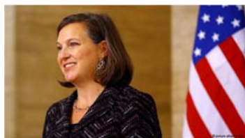
Subsecretária de Estado Victoria Nuland

Comentário de vice-secretária de Estado sobre Ucrânia foi grampeado e divulgado na internet.