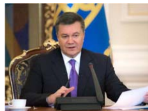
Presid. da Ucrânia Viktor Yanukovich

Presidente da Comissão Europeia, porém, diz que não competirá com Rússia “para ver quem paga mais por acordo”. Após licença médica, Yanukovich retorna ao trabalho e deve indicar novo primeiro-ministro para suceder Azarov .