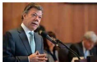
Presidente da Colômbia Juan M. Santos