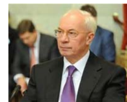
Ex-Primeiro Ministro Mykola Azarov